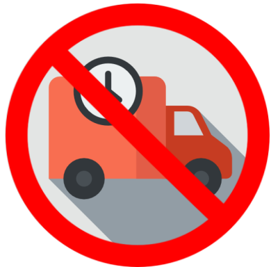
因超過備貨天數而被系統取消訂單