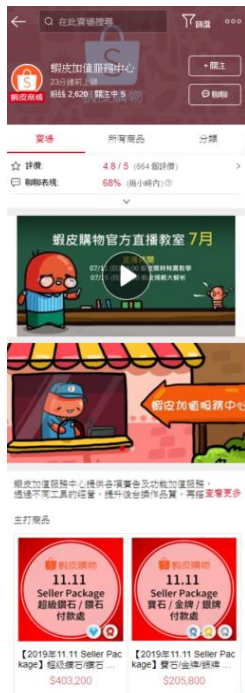
使用賣場首頁佈置：基礎版